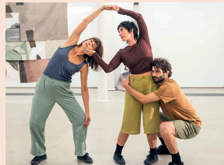
TanzKollektivBremen