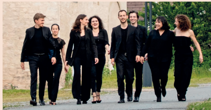
franz ensemble

Eine Reise in das Wien um 1800 mit Musik von Helena Winkelmann (*1974) und Ludwig van Beethoven (1770-1827) mit dem franz ensemble . Eintritt: 22,-/ 9,- Euro